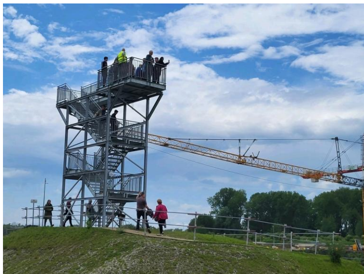
Uitkijktoren Liefkenshoektunnel L.O.

Duur bezoek: circa 2 uur met een presentatie over de Oosterweelwerken en een wandeling naar de uitkijktoren, waar je de omvang van de indrukwekkende werken kan bekijken met een mooi, globaal overzicht over de tunneltoerit en de tunnelmond en hoe deze opgebouwd worden.